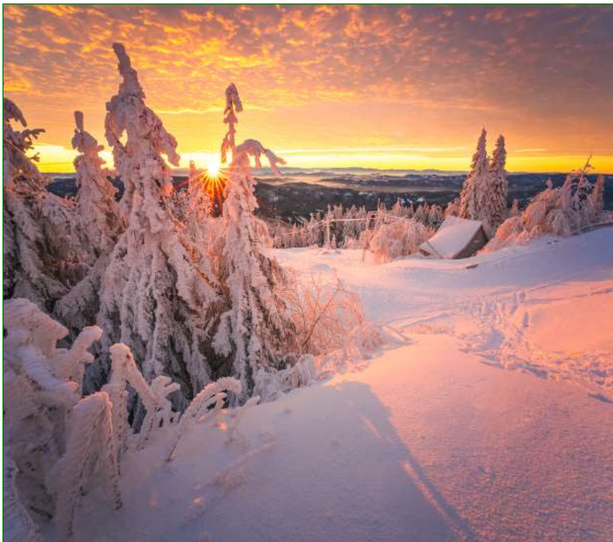
Mrazivé ráno na Lysé hoře...