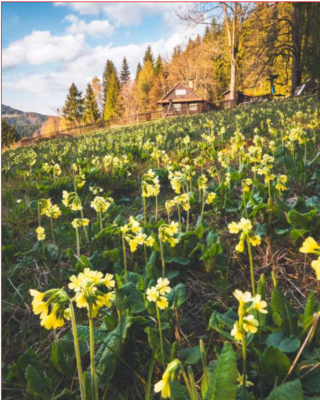
Rozkvetlé jaro pod Gruněm...